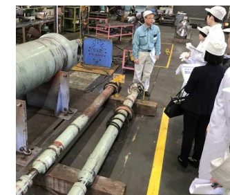
写真2. 現地指導の例